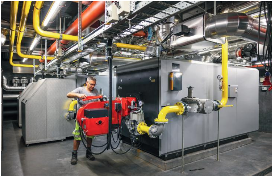
Als kompetenter Partner für Heiz- und Kühlsysteme baut Eniwa das Netz der Fernwärme/Fernkälte Schritt für Schritt aus.

Von Densbüren bis Reitnau und von Rohr bis Menziken liefert Eniwa Energie für rund 100 000 Menschen in 30 Gemeinden im Grossraum Aarau. Versorgungssicherheit, Innovation, Regionalität und Nachhaltigkeit stehen für das Unternehmen an oberster Stelle.