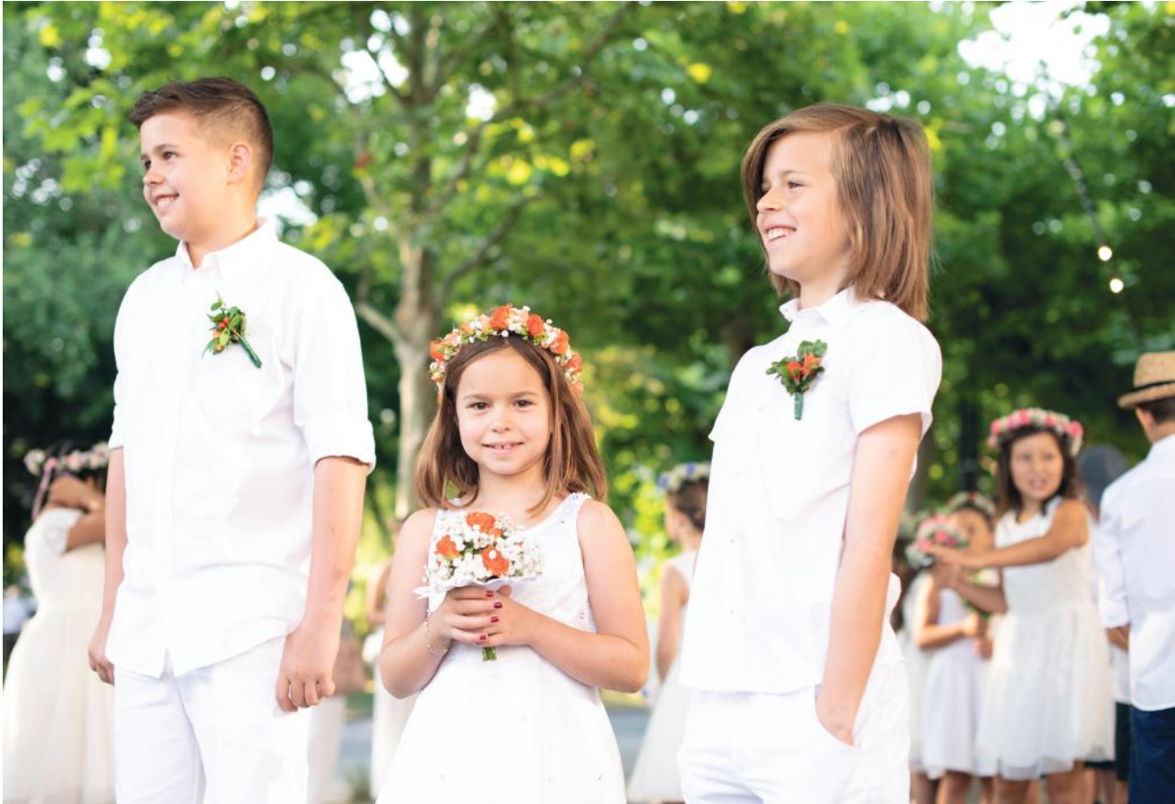
Der Maienzug, das Aarauer Jugendfest, ist der wichtigste Festtag in Aaraus Jahresprogramm und wird jeweils mit dem Kinderumzug und einem Bankett am erstem Freitag im Juli gefeiert.

Das Aargauer Kunsthaus zählt zu den wichtigsten Kunstmuseen der Schweiz.