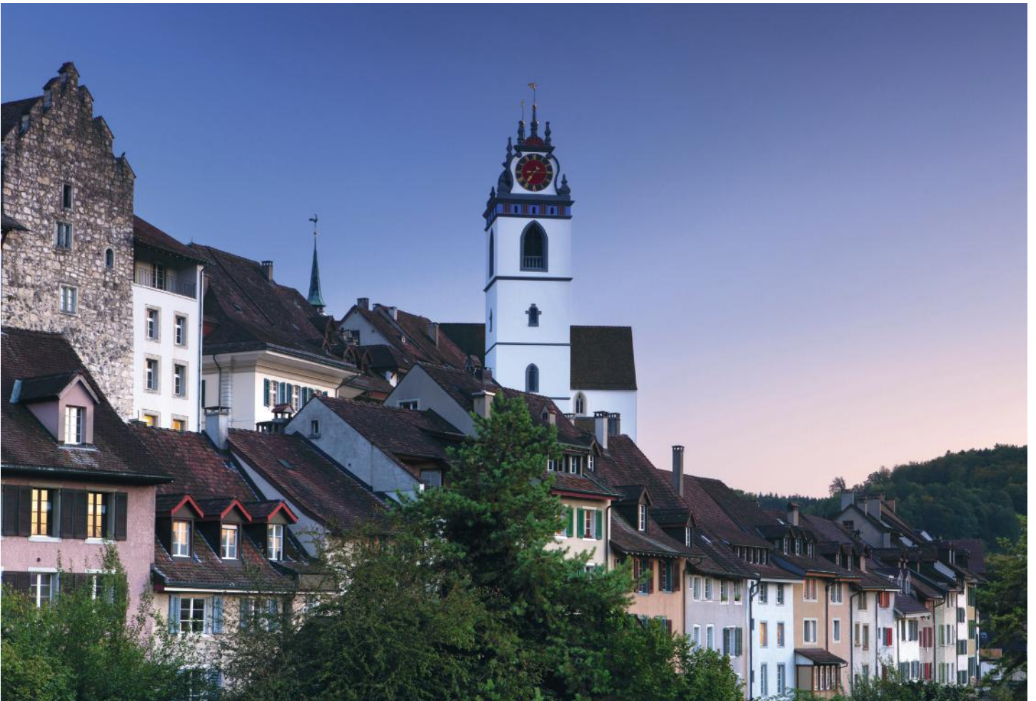
Altstadt von Aarau