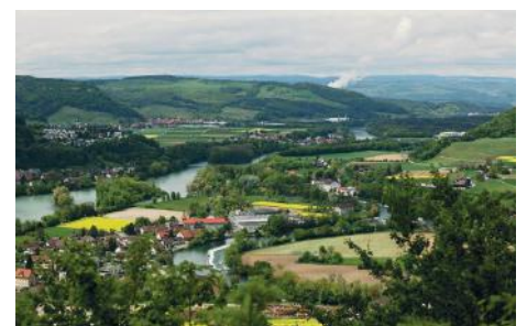
Wasserschloss der Schweiz, Aargau

Ortsbürger zu sein, ist kein Privileg, welches erlaubt, einen Nutzen daraus zu ziehen. Es ist vielmehr die Identifikation mit seinem Heimatort und seinem langjährigen Wohnort. ☺