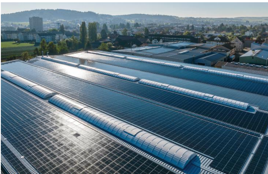
Photovoltaikanlagen-Anlagen für ganze Areale oder das Einfamilienhaus: Eniwa bietet die passende Anlage und Zusatzangebote wie Speicher, Ladeinfrastruktur für Elektroautos und vieles mehr.