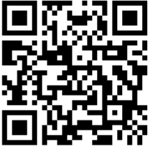
Plan Stadt Aarau

Hinweise zur Anreise, Anmeldung und Stadt Aarau: bitte QR-Code scannen.