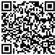
Film über Aarau