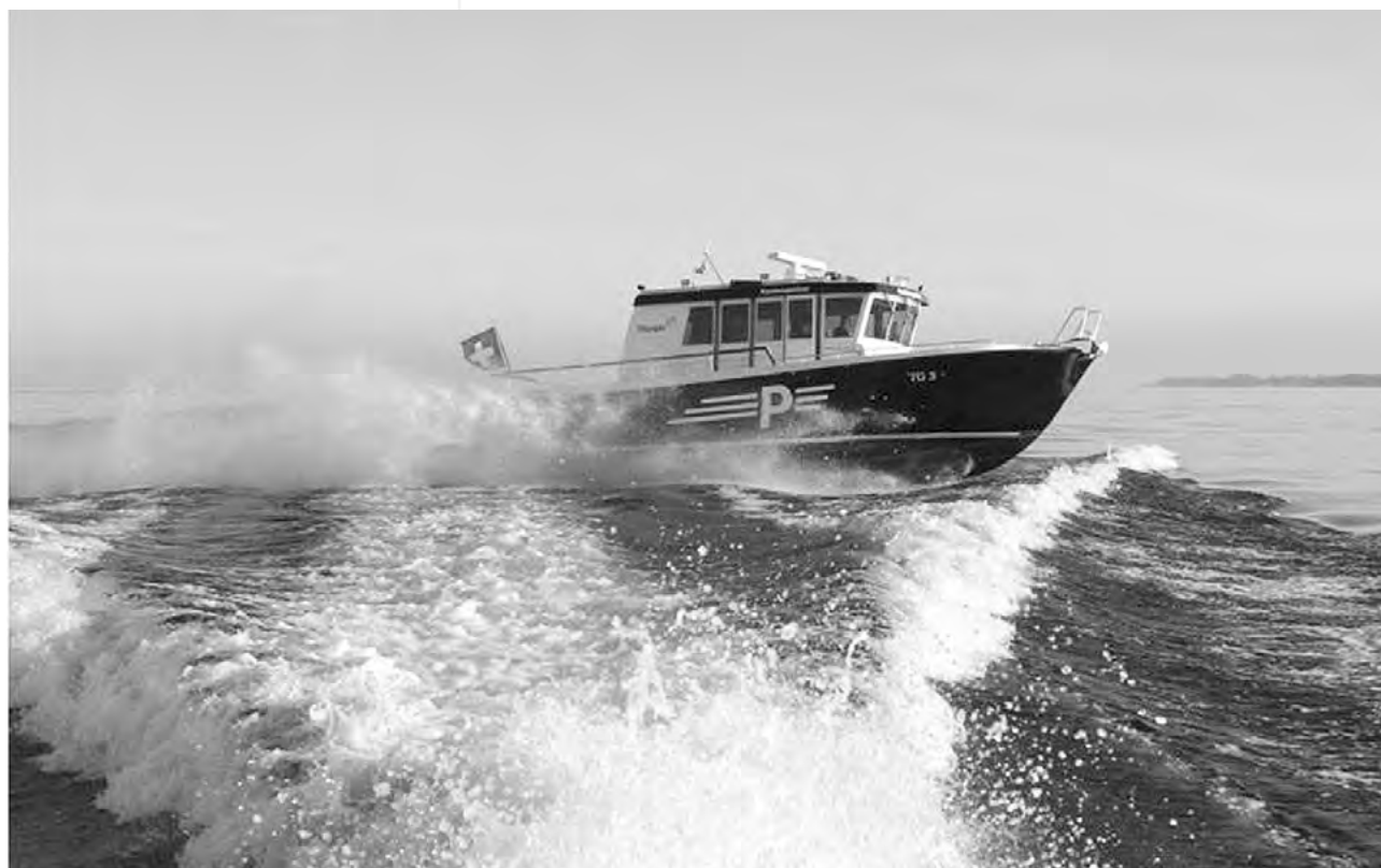
EIN POLIZEIBOOT IN AKTION