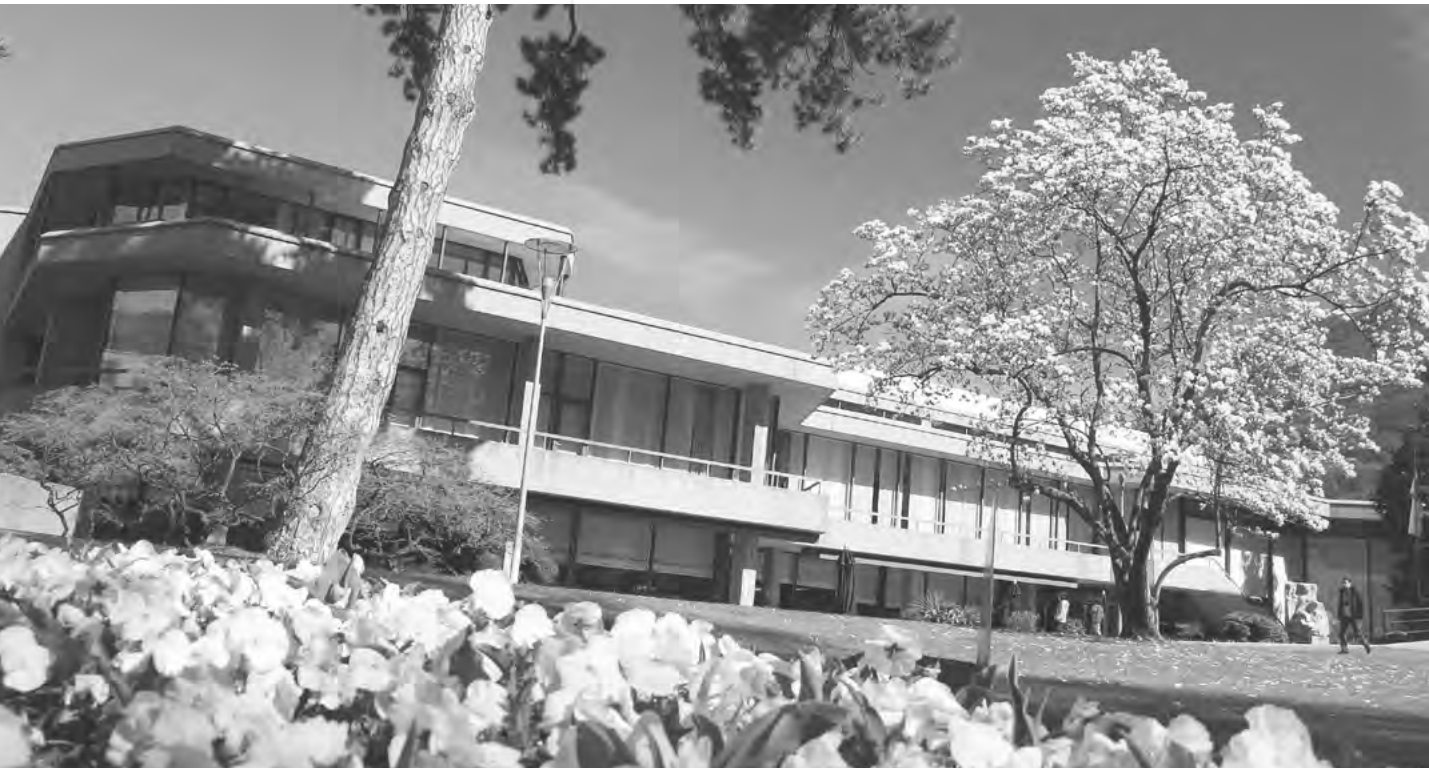
PALAZZO DEI CONGRESSI DI LUGANO

Natale in Piazza, Paqua in città o la Festa d'Autunno, sono solo alcuni esempi del vasto panorama di attività di cui approfittare durante una visita a Lugano. Gli amanti dell'arte, della scultura e dell'architettura, invece, possono visitare i musei d'arte della città e le splendide chiese, da quelle romaniche a quelle barocche, disseminate per tutta la regione. Appena fuori dal centro cittadino si diramano una miriade di sentieri che portano, attraversando magnifici boschi, a località pittoresche come Gandria, in riva al Ceresio, o Brè, abbarbicato sull'omonimo monte. Per gli escursionisti più esigenti il Monte Lema, il Tamaro, il