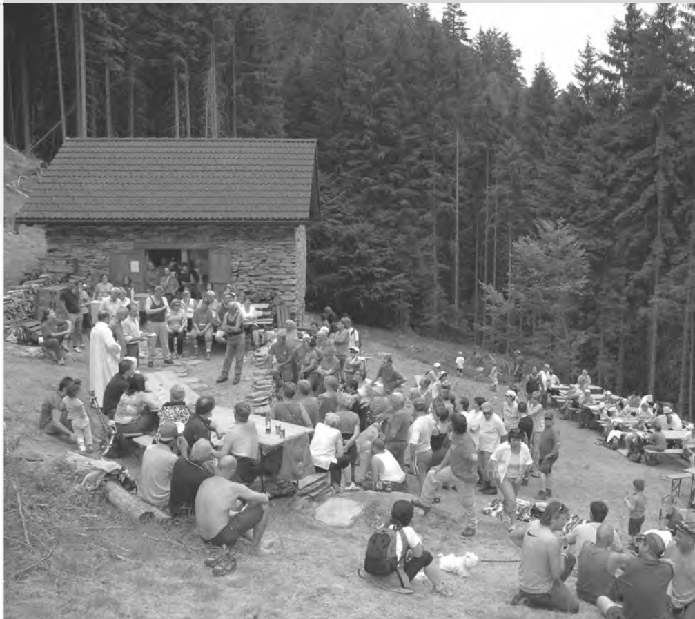
INAUGURAZIONE TECC STEVAN IN VAL D'AMBRA