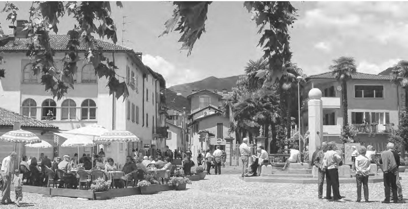
DER DIREKT AM SEE GELEGENE DORF- PLATZ VON CASLANO, DIE PIAZZA LAGO

Festival, musikalische Darbietungen auf allerhöchstem Niveau, wie z.B. das Lugano Festival, Familienveranstaltungen wie Weihnachten auf der Piazza, Ostern in der Stadt oder das Herbstfest sind nur einige Beispiele aus dem riesigen Angebot an Aktivitäten, aus denen Sie bei einem Besuch in Lugano wählen können. Die Liebhaber von Kunst, Bildhauerei und Architektur können die Kunstmuseen der Stadt und die eindrucksvollen romanischen und barocken Kirchen besuchen, die in der gesamten Region zu finden sind. Gleich vor der Stadt verzweigen sich unzählige Wanderwege, die durch beeindruckende Wälder und zu pittoresken Orten führen, wie z.B. Gandria an den Ufern des Luganer Sees oder Brè am Hängen des gleichnamigen Bergs. Besonders anspruchsvollen