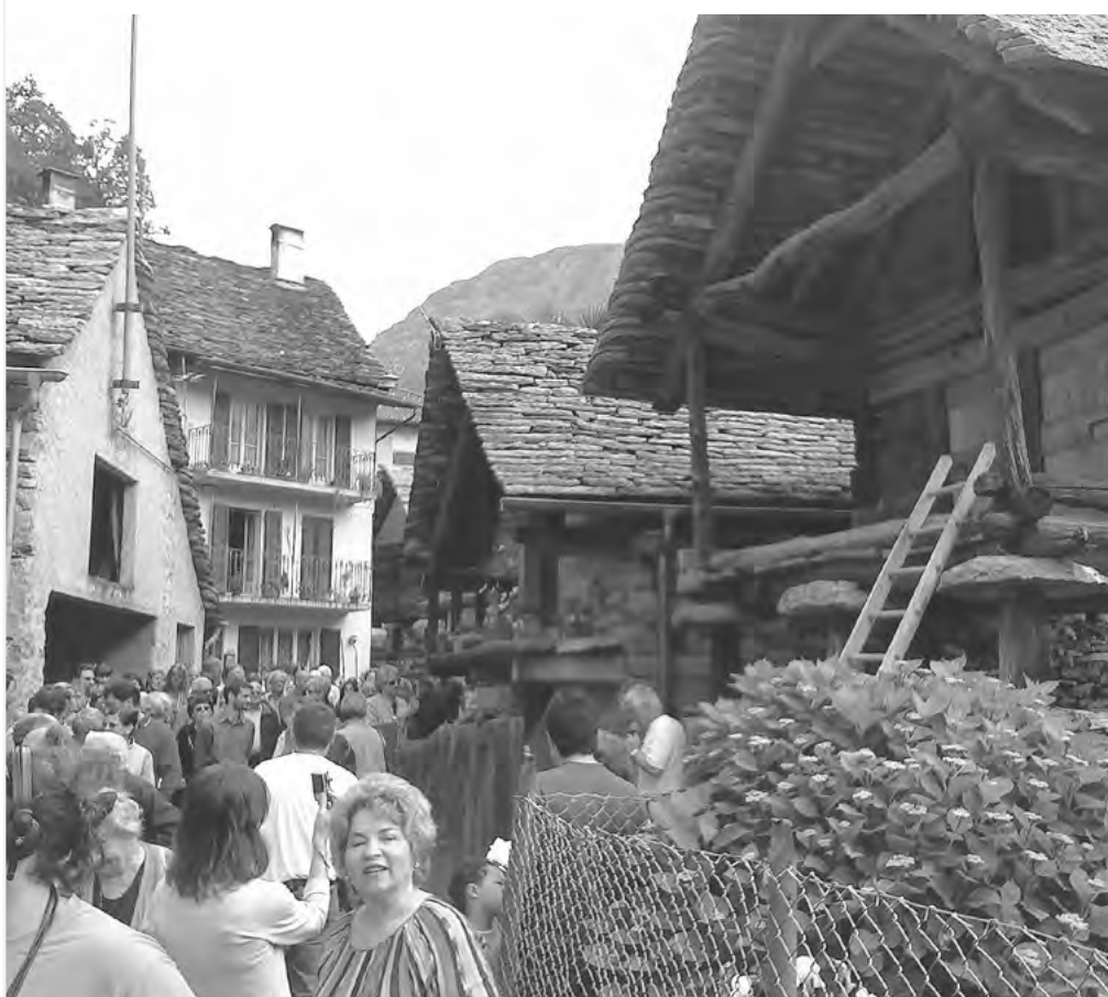
RESTAURO TORBA DI MOGHEGNO, VALLE MAGGIA