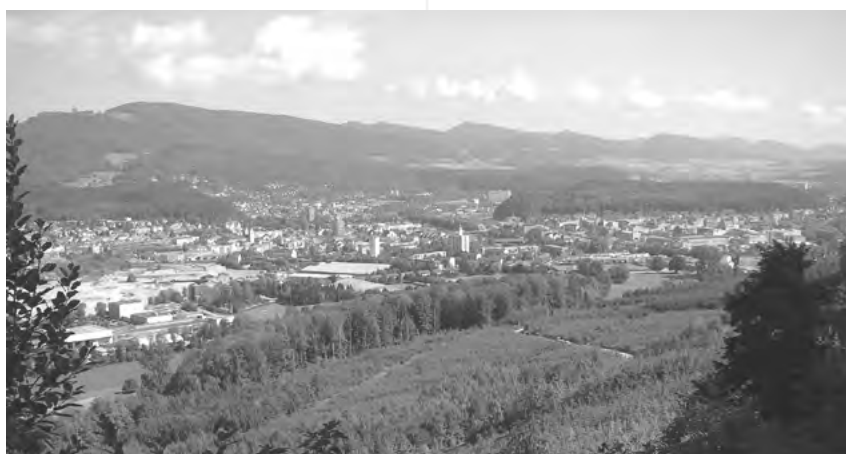
GELÄNDE DER WALDTAGE

vitäten sowie das Schulprogramm. Neben vielem anderem muss auch der Betrieb der Waldbeizen geplant, das Verkehrs- und Sicherheitskonzept erarbeitet und der Personaleinsatz geregelt werden.