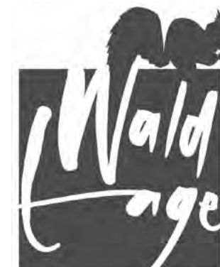
SOLOTHURNER WALDTAGE 2014