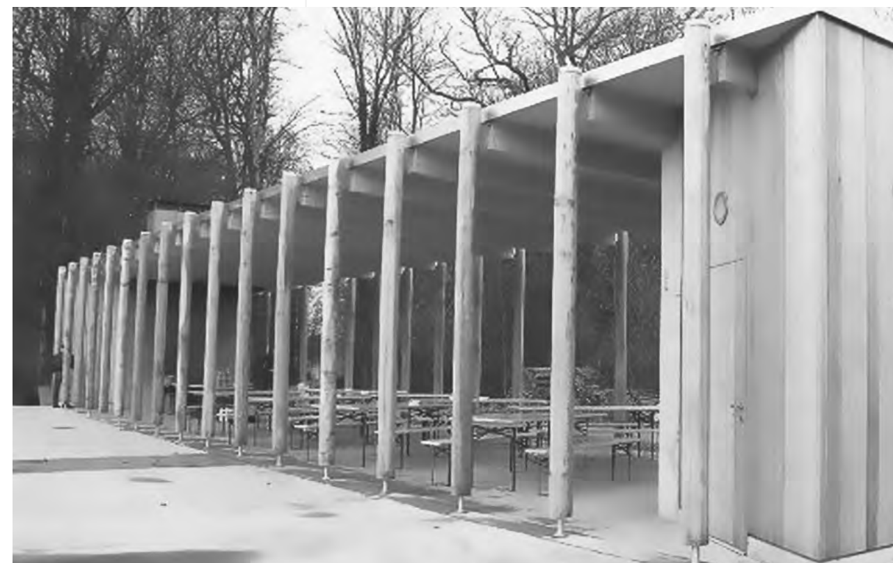
UNTERSTAND DER WILDSAUENHÜTTE

Höhe Stuttgart, der Trinkwasserspeicher. Dementsprechend umfangreich ist die Ausrüstung. In grossen Hallen findet man Ölwehrfahrzeuge, Materialwagen mit Tauchausrüstungen und eine Werkstatt für die Unterhaltsarbeiten. Grosse Aufmerksamkeit schenken wir den 4 Polizeibooten und speziell dem neusten Schiff «TG 3». Zwei nebeneinander liegende 6 Zylinder Turbodieselmotoren treiben je eine Schraube an.