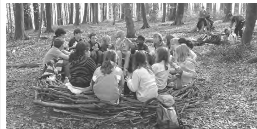
MÄRLIWALD FÜR DIE KINDER

FÜR WEITERE AUSKÜNFTE: DIE HOMEPAGE WWW.WALDTAGE-SO.CH ORIENTIERT IMMER AKTUELL ÜBER DEN ANLASS!