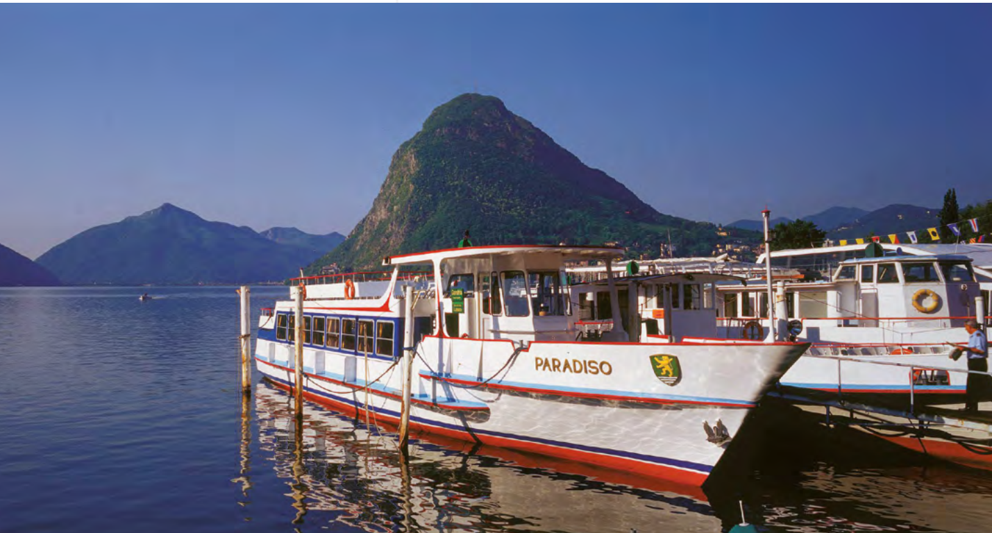
NAVIGATION SUR LE LAC DE LUGANO

niveau telles que Lugano Festival, manifestations de divertissement pour les familles telles que Noël sur la place, Pâques en ville ou la Fête d'automne, ne sont que quelques exemples du vaste programme d'activités dont on peut profiter en venant visiter Lugano. Les amateurs d'art, de sculpture et d'architecture pourront visiter les musées d'art de la ville et les magnifiques églises romanes et baroques disséminées dans toute la région. Juste aux portes de la ville, une myriade de sentiers conduisent à travers bois vers des localités pittoresques telles que Gandria, situé au bord du lac Ceresio, ou Brè accroché au flanc du mont homonyme. Pour les randonneurs plus exigeants, le Mont Lema, le