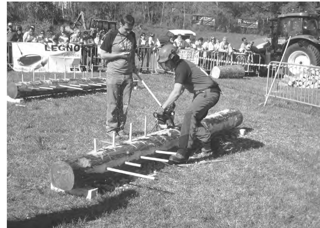
IMMAGINE: 1-2 PENTATLON DEL BOSCAIOLO

Nelle immagini, più che nelle parole, la tradizione di quanto di buono sono in grado di proporre i Patrizi oggi giorno non solo nel rispetto di quanto trasmessoci ma soprattutto in visione prospettica futura per la cura del nostro splendido territorio. ■