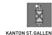
KANTON ST. GALLEN

Ein weiterer Erfolgsfaktor für den Erhalt des seit 1987 vergebenen Binding Waldpreises ist die hohe Dialogkultur, welche am Blauen gepflegt wird. Bevölkerung, Partner und Behörden werden über Aktualitäten und Projekte informiert. Information und Kontakt mit den Betroffenen sind sehr wichtig um gute Arbeitsbeziehungen aufzubauen, neue Projekte umzusetzen sowie den Rückhalt und die Akzeptanz der Forstbetriebsgemeinschaft zu stärken. Mit dem Erhalt des Binding Waldpreises stehen der Forstbetriebsgemeinschaft am Blauen auch weiterhin Mittel zur Verfügung um innovative Projekte umzusetzen. ■