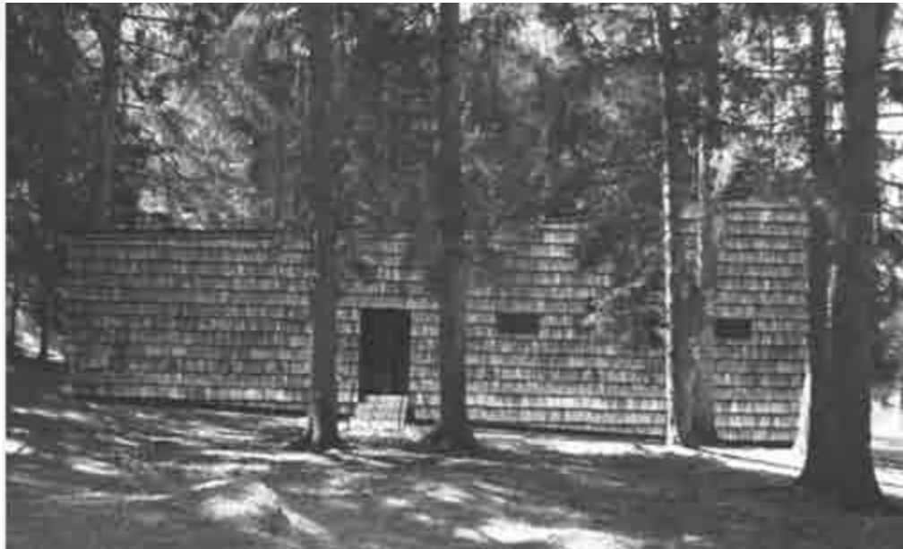
AUSSENANSICHT DER TEGIA DA VAUT / WALDHÜTTE