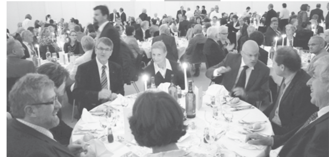
EIN FROHER VORSTANDTISCH