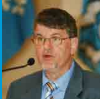
RUDOLF GRÜNINGER, BASEL ■ PRÄSIDENT, SCHWEIZERISCHER VERBAND DER BÜRGERGEMEINDEN UND KORPORATIONEN