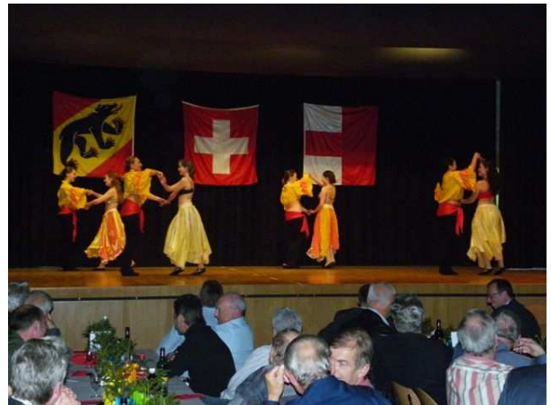
Showdancer erfreuen die Zuschauer mit einer farbenfrohen und Lebensfreude ausstrahlenden Einlage.